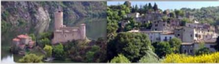
Gorges de la Loire Villages pittoresques

Location vacances scolaires Été / Hiver et week ends