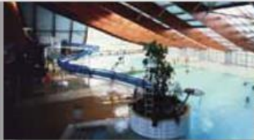
Piscine à vagues