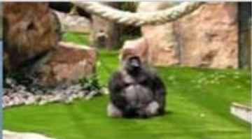
Zoo St Martin la Plaine