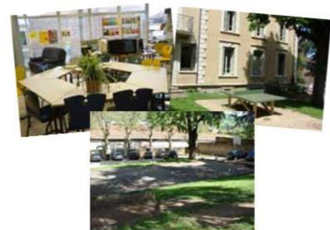
Sport et culture